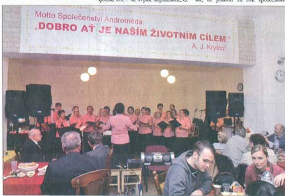
Na Světový den hospiců se ve Chmelčtině scházejí staří i mladá, zdraví i nemocní. Vystoupení pěveckého sboru Magistrae Raconenses v r. 2009.

V areálu Andromédy je »k dispozici« nepřeberně množství pracovenku i uvnitř budovy. Vyzařuje zde také ovocný sad pro budoucí klienty, starají se o ponika Polka, o pejsky a kočky. A vítají, když k nim čas od času přijedou dobrovolníci. V loňském roce jich přijelo celkem 96 z celé republiky. Nejen, že se tak odvede kus práce v příjemném a srovnacím prostředí, ale prostřednictvím lidí z různých koutů země a různých profesí dochází k propagaci i odkryje, že Společenství Androméda nevzniklo náhodně, »jen tak«. Lidé, kteří je založili, si prožili své – se svými nejbližšími, či