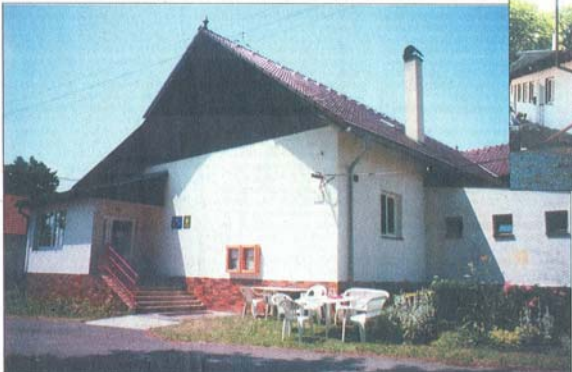
Objekt bývalé hospody ve Velké Chmelčtině na Rakovnicku se postupně mění na moderní a pohodlné středisko péče o staré a těžce nemocné, ale také na centrum společenského života