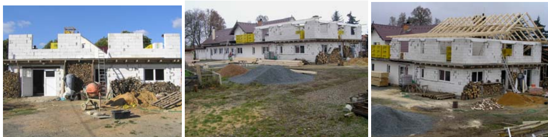
Postup rekonstrukčních prací – zastřešování přístavby