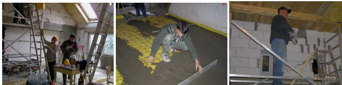
Budoucí stacionář na konci objektu